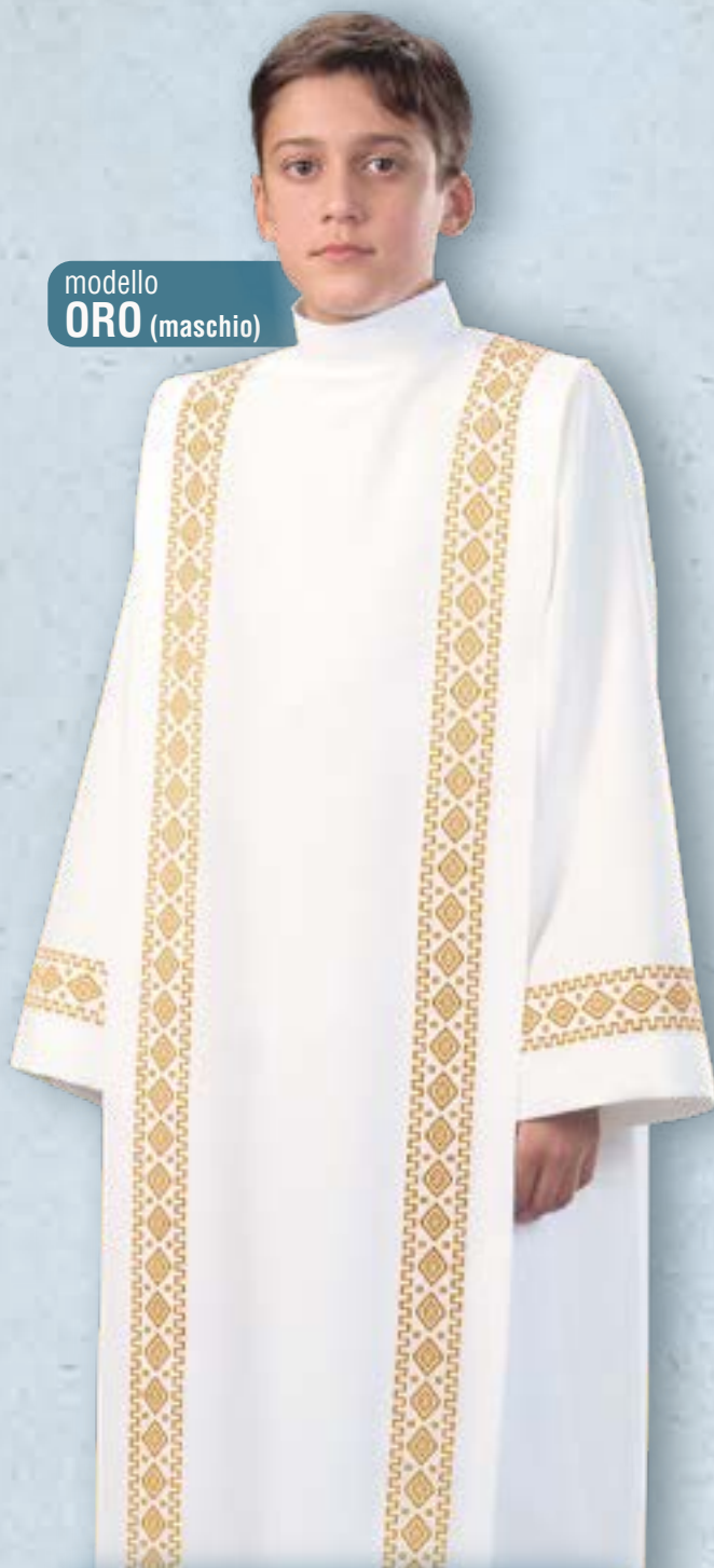
modello ORO (maschio)